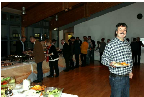
Beste Versorgung am Buffett