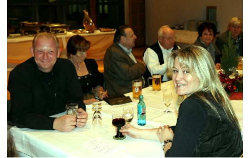
Gute Stimmung bei Mitgliedern und Gästen