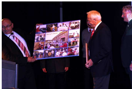
Präsent der IGHL für ihren Ehrevorsitzenden